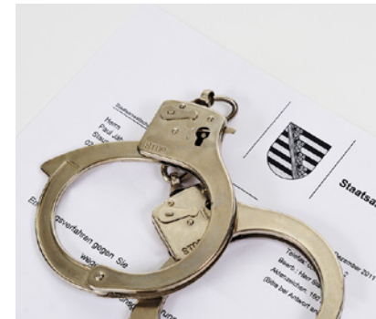
RECHT UND JUSTIZ