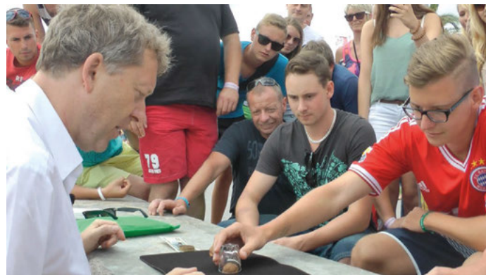
Hütchenspieler auf der Uferpromenade. Die Gäste haben keine Chance gegen den Hauptkommissar.

Zu einem Erlebnis der besonderen Art wurde das Hütchenspiel. Mit der Professionalität echter Hütchenspieler verwirrte der Hauptkommissar die Schar der Zuschauer, die sich um das Geschehen auf der Promenade gruppierten, so gekonnt, dass es keinem gelang, das eingesetzte Geld zu gewinnen. Natürlich wurde niemand wirklich abgezockt. Nach jeder Aktion gab es eine Aufklärung und die obligatorischen Hinweise, die helfen können, nicht Opfer von Trickdieben zu werden.